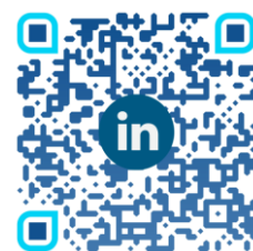
LinkedIn SoWiSo Kempten e.V.