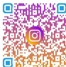
Instagram Sowiso kempten