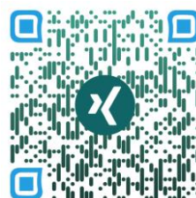
Xing SoWiSo e.V.