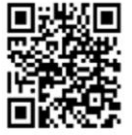
Xing SoWiSo e.V.